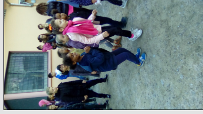
Danse à Motyisset