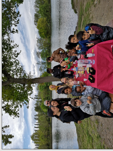
Détente au Lac de Soues