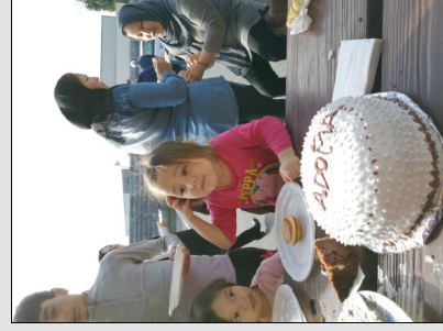
Goûter au Pradha