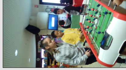
A la Ludothèque